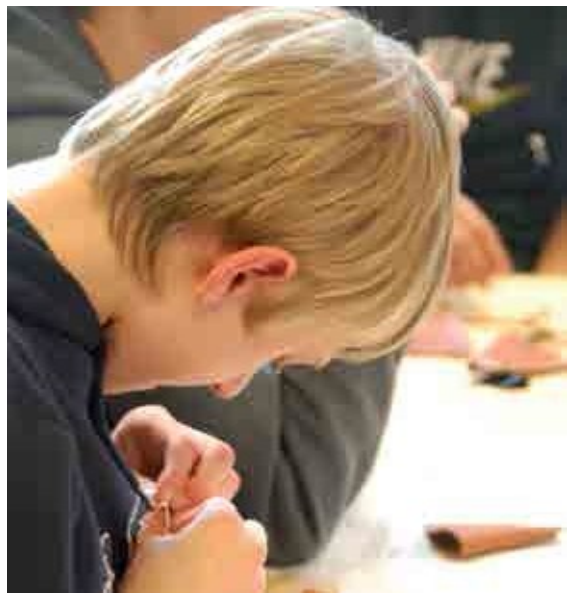
Avainkoda. Jokainen askarrella poron nahasta itselleen avainkotelon. Työ oli varsin vaativa.

Silkkaa saamelaisuutta -oppimispolulla ryhmät ratkaisivat saamelaiskulttuuriin liittyviä tehtäväkortteja museon perusnäyttelyssä. Polulla tutustuttiin muun muassa saamelaisiin tapoihin, käsitöihin, elinkeinoihin sekä saamelaisalueisiin. Tehtävät vaativat havainnointia, oivaltamista ja päättelykykyä. Tehtävien vastauksilla ratkaistiin polkuun liittyvä ristikko.