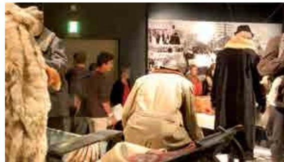
Pohjoisen porukkaa. Tutustuimme monipuolisesti saamelaisuuteen ja Lapin historiaan.