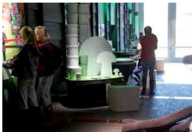
Tutustuimme monipuolisesti metsien kestävästä käyttöön.

Osallistuimme Tiedekeskus Pilkkeessä metsien kestävästä käytöstä työpajaan, jossa ryhmittäin tutustuttiin siihen, mitä erilaisia hyötyjä metsä meille ihmisille tarjoaa ja miten voimme käyttää metsiä kestäväällä tavalla. Ryhmien tehtävänä oli tuottaa metsän tarjoamia ekosysteemipalveluita kestävästi käyttöön pohjautuen: ekologisia, kulttuurisia, sosiaalisia ja taloudellisia. Ryhmät tekivät erilaisia tehtäviä ja kokeilivat yhdessä, saavutetaanko metsien kestävästä käytöstä tasapaino. Hauskaa oli se, että oppilaat toimivat ryhmissä, ja ryhmät joutuivat toimimaan vielä yhdessä. Tähän ei ole paljoa mahdollisuuksia normaalisti koulussa. Myös tässä tehtävän kuvaus on lainattu, tällä kertalla Tiedekeskus Pilkkeen internet-sivulta.